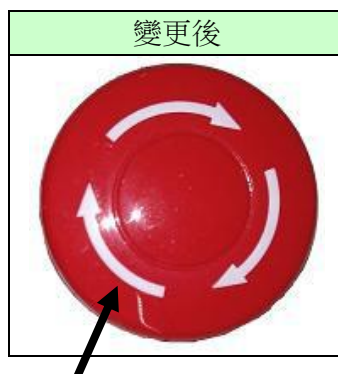
直接在按鈕表面(無凹陷)印上白色