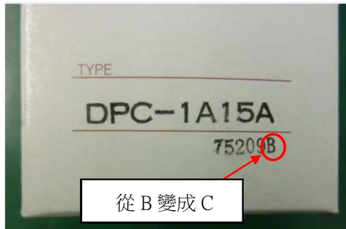
圖 2: 批號的標示(個裝盒)