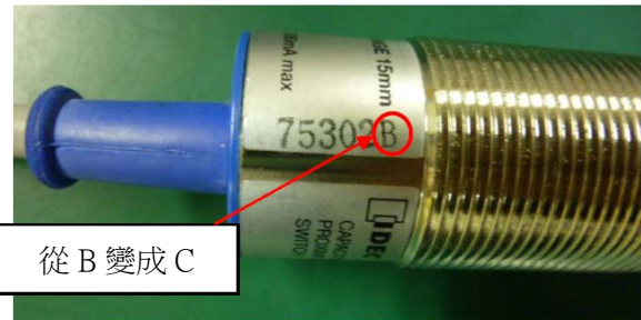
圖 3: 批號的標示(製品本體)