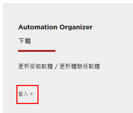
圖 序-1 軟體下載

https://tw.idec.com/idec-tw/zh_TW/TWD/RD/software/Software-Downloads-tw